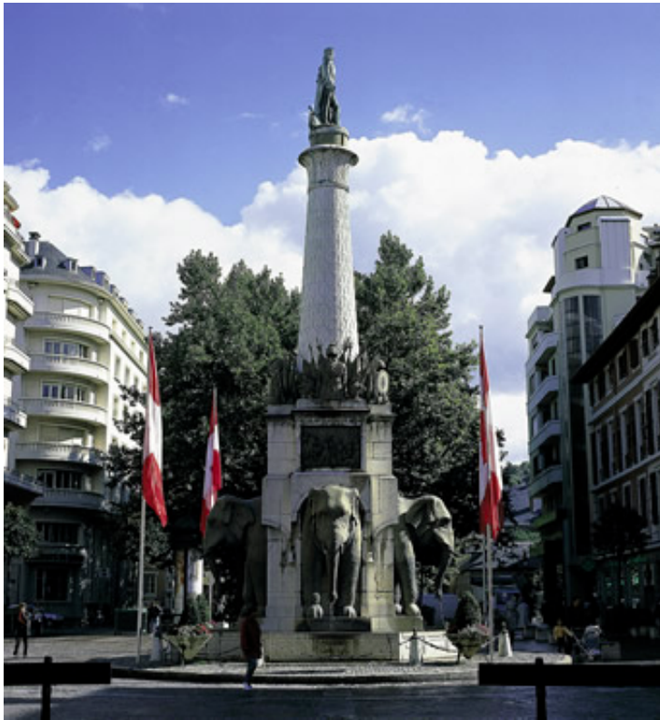
La Fontaine des Éléphants

La Fontaine des Éléphants est un monument commémoratif célébrant le Général de Boigne.