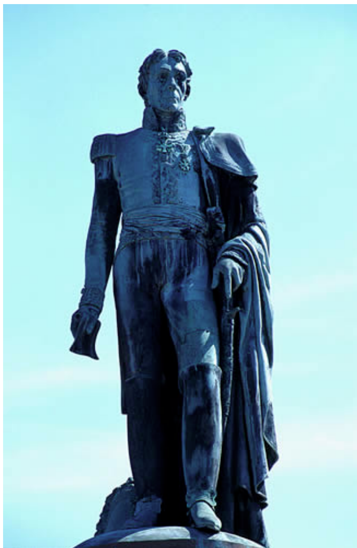
La statue du Général de Boigne

Épargnée par le bombardement de mai 1944, la statue trône fièrement dans la perspective de la rue de Boigne et reste encore aujourd'hui un emblème fort de la ville.