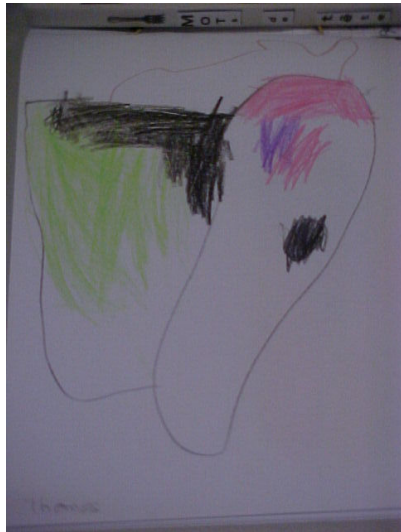
croquis 1 de Thomas