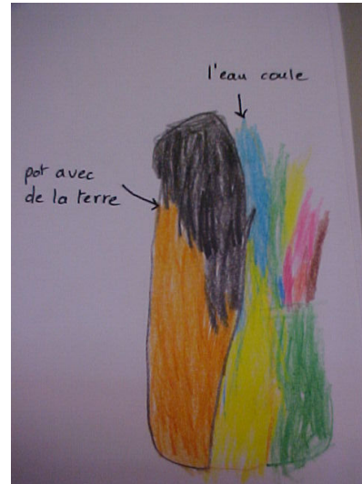
croquis 2 de Thomas