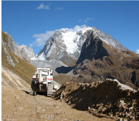
Travaux en montagne Piste noire – Pralogan-la-Vanoise (73)

Titulaire de la qualification FNTF 2311, Forézienne participe à l'élargissement et la création de tronçons autoroutiers ainsi qu'à la construction de lignes ferroviaires à grande vitesse. Répartie en agences à portée régionale, Forézienne intervient également sur des opérations plus modestes, liées à des chantiers de bâtiment, notamment. S'appuyant sur ses services techniques, Environnement, Dépollution, Géotechnique, Topographie, Minage et Matériel... l'entreprise maîtrise toutes les techniques : terrassements urbains, en cours d'eau ou en montagne, réalisation de centres d'enfouissement technique, de plates-formes logistiques ou de barrages.