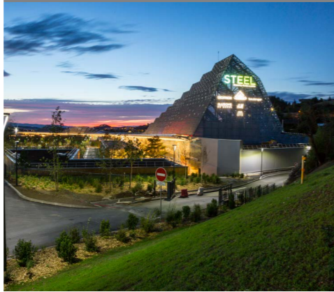
Plate-forme industrielles et commerciales Centre commercial Steel – Saint-Etienne (42)