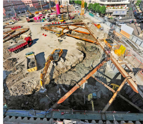
Travaux en milieu urbain Carré Jaude 2 – Clermont-Ferrand (63)