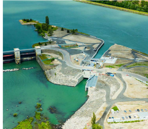
Dignes et barrages PCH – Pouzin (07)