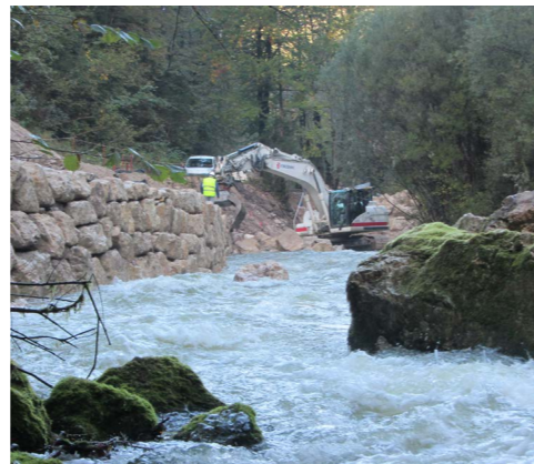
Travaux en cours d'eau Berges du Flumen - Jura (39)