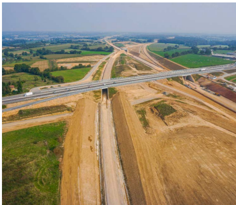
Travaux ferroviaires neufs et restauration LGV Bretagne-Pays de Loire - Mayenne (53)