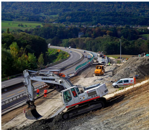
Travaux autoroutiers A43 – La-Motte-Servolex (73)