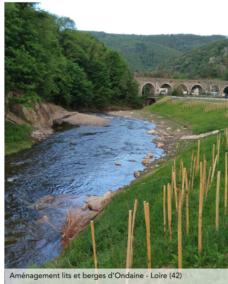
Aménagement lits et berges d'Ondaine - Loire (42)