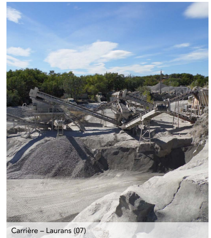
Carrière – Laurans (07)