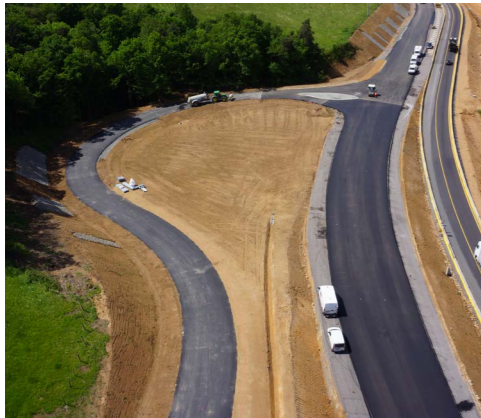
Travaux routiers régionaux RN82 – Neulise-Balbigny (42)