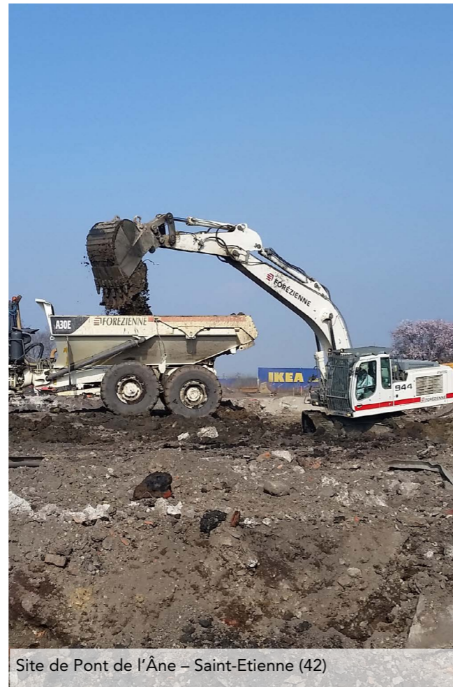
Site de Pont de l'Âne - Saint-Etienne (42)