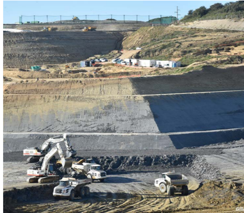
Centres d'enfouissement technique SITA – Bellargarde (30)