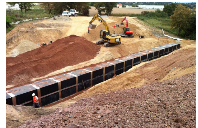
Liaison A6 - A89 – Rhône (69)