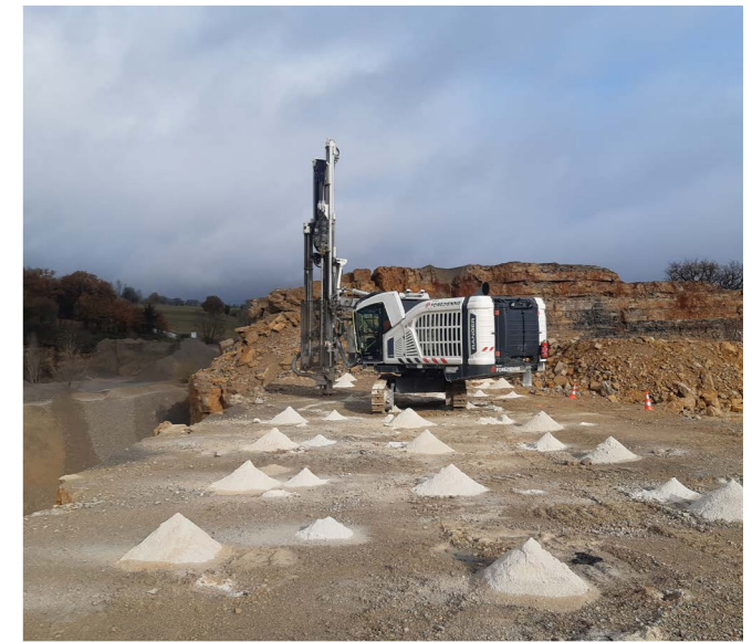
Carrière de Crochet - Chasteaux (19)

Forézienne exploite une Installation de stockage de déchets inertes (ISDI) à Saint-Etienne (42) : « Vallon du Vernet ». L'installation accueille les déchets inertes des entreprises de BTP de l'agglomération stéphanoise, pour une capacité de 150 000 m 3 /an. Elle est gérée par contrat de délégation de service public.