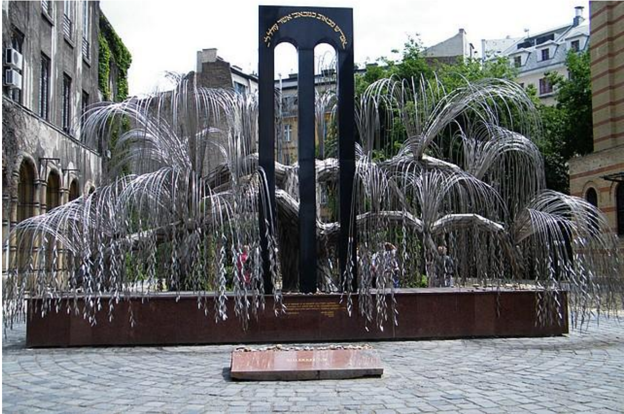
L'arbre de vie : mémorial aux victimes du génocide et le musée juif.