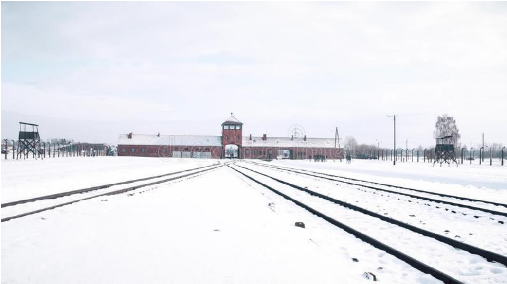
Entrée du camp 2 : Auschwitz Birkenau