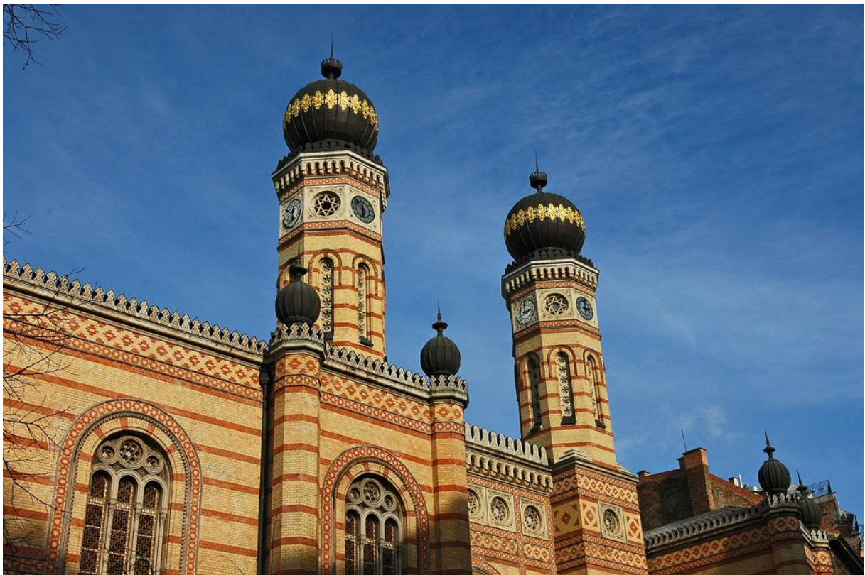
La Grande synagogue de Budapest

Appréhender les vestiges d'une communauté disparue.