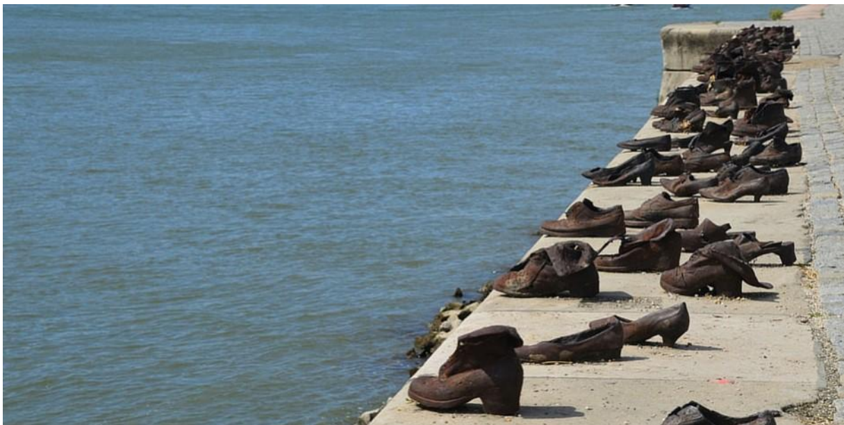
Mémorial des chaussures sur le Danube. Lieu de commémoration des massacres perpétrés par les Croix fléchés (parti antisémite hongrois)