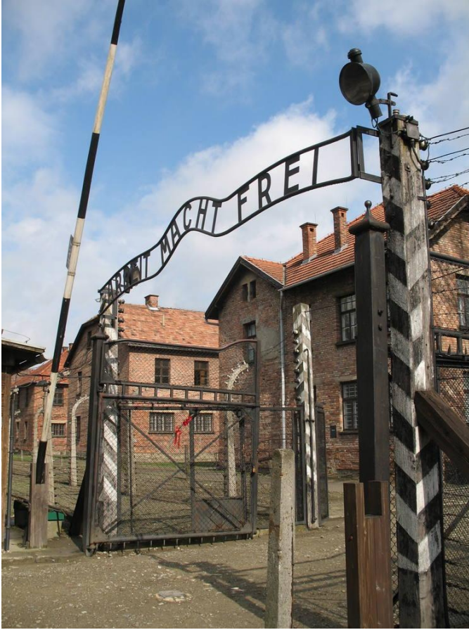
Entrée du camp 1.

La journée sera consacrée à la visite du complexe concentrationnaire d'Auschwitz Birkenau.