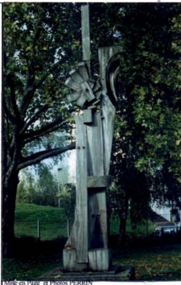
Mise en Page et Photos PERRIN

*Mon petit doigt ( de bois ) me dit que l'on reparlera de moi en Dessin d'Art.