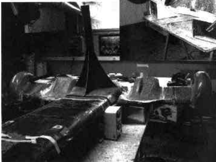
Machine face arrière