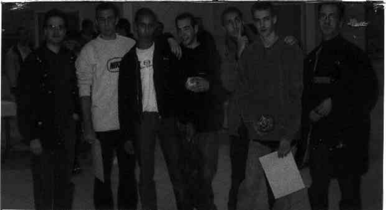
Les ex-TEN entourés de leurs professeurs d'Electronique

C'est un jeudi soir de Novembre que les lauréats BEP MSMA , TEN et TEL et les BACS MSMA et EIE sont venus chercher leur diplôme, autour d'un copieux et agréable buffet, entourés de leurs anciens profes- seurs.. Remerciements aux organisateurs et au service .