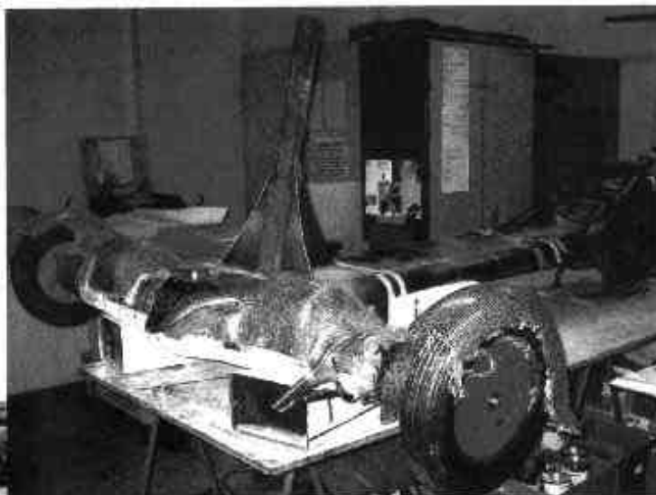
Machine face avant