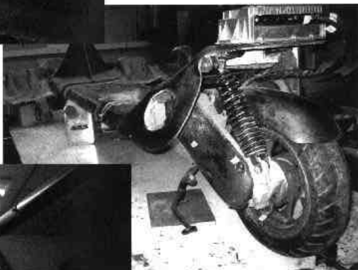
Motorisation PEUGEOT Scootélec