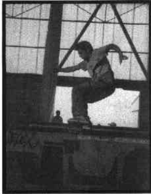
SOY PANDAIE NOSE SLIDE