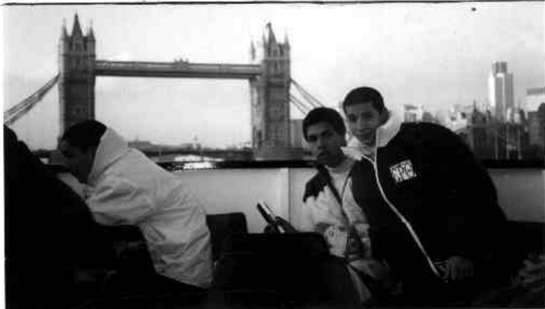
Devant le Tower-Bridge(haut ) et à Trafalgar-Square (bas )

Les classes de Mr Perrin en Géographie ( TEL3 et SEL2 ) ont réalisé en début d'année (janvier et février 99 ) une série de panneaux concernant le continent africain . Le but était de sensibiliser les différents passants intérieurs ou extérieurs à l'établissement au projet Mauritanie 2000 orchestré par le TOPP GROUPE. On a pu découvrir des panneaux sur certains pays peu touristiques comme le Mali ou la Libye, d'autres plus fréquentés; citons le Sénégal ou l'Afrique du Sud . Riches en documents, certains états ont davantage inspiré les élèves : ce fut le cas de la Tunisie ou du Maroc voire l'Egypte des Pharaons . A cela s'est jointe une série de panneaux thématiques sur le désert (Les pierres façonnées parle vent, les ethnies...) D'autres révèlent les mythes et les symboles de l'Afrique éternelle(Portes orientales , visages ) Le tout ponctué de citations d'auteurs et de textes créés par les élèves eux-mêmes ; ils ont su associer collages, esthétiques , coloration et frappe de textes . Bravo ! ( Ces panneaux sont en réserve et peuvent être prêtés ; Dans le hall subsistent les deux panneaux du Speed-board et ceux de la Mauritanie et du Sénégal "pour entretenir la flamme" du projet jusqu'au printemps 2000 .)