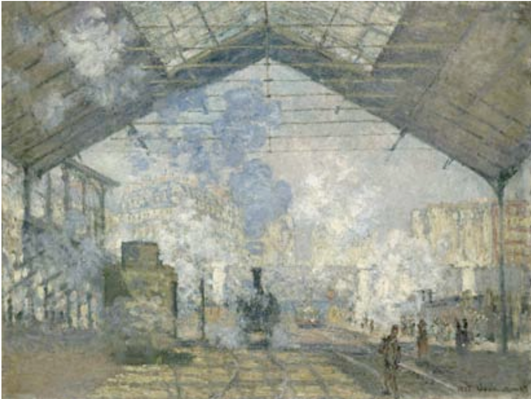
Claude Monet (1840-1926) La Gare Saint-Lazare, 1877 Huile sur toile, H. 75 ; L. 100 cm Paris, musée d'Orsay, legs Gustave Caillebotte, 1894