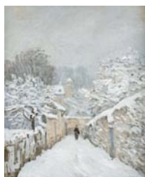
Alfred Sisley (1839-1899) La Neige à Louveciennes, 1878 Huile sur toile, H. 61 ; L. 50,5 cm Paris, musée d'Orsay