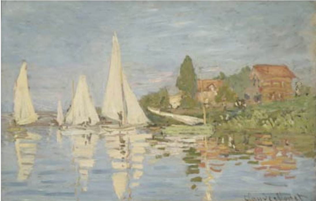
Claude Monet (1840-1926) Régates à Argenteuil, 1872 Huile sur toile, H. 48 ; L. 75 cm Paris, musée d'Orsay