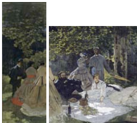
Claude Monet (1840-1926) Fragments du Déjeuner sur l'herbe, 1865 Huile sur toile, H. 418 ; L. 150 cm, et H. 248 ; L. 217 cm Paris, musée d'Orsay

Claude Monet a gardé ce tableau qui représente, lui aussi, le jardin de sa tante.