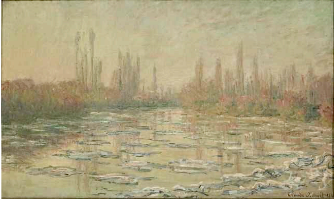
Claude Monet (1840-1926) Les Glaçons , 1880 Huile sur toile, H. 61 ; L. 100 cm Paris, musée d'Orsay