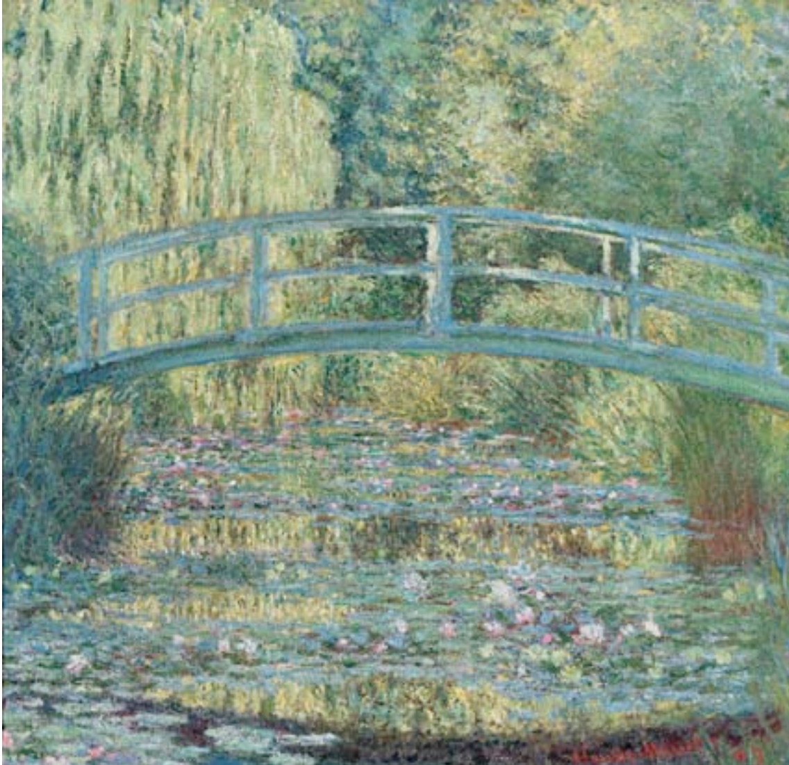
Claude Monet (1840-1926) Le Bassin aux nymphéas, harmonie verte, 1899 Huile sur toile, H. 89 ; L. 93 cm Paris, musée d'Orsay