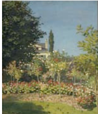
Claude Monet (1840-1926) Jardin en fleurs, été 1866 ou 1867 Huile sur toile, H. 55 ; L. 57 cm Paris, musée d'Orsay

Claude Monet a gardé ce tableau qui représente, lui aussi, le jardin de sa tante.