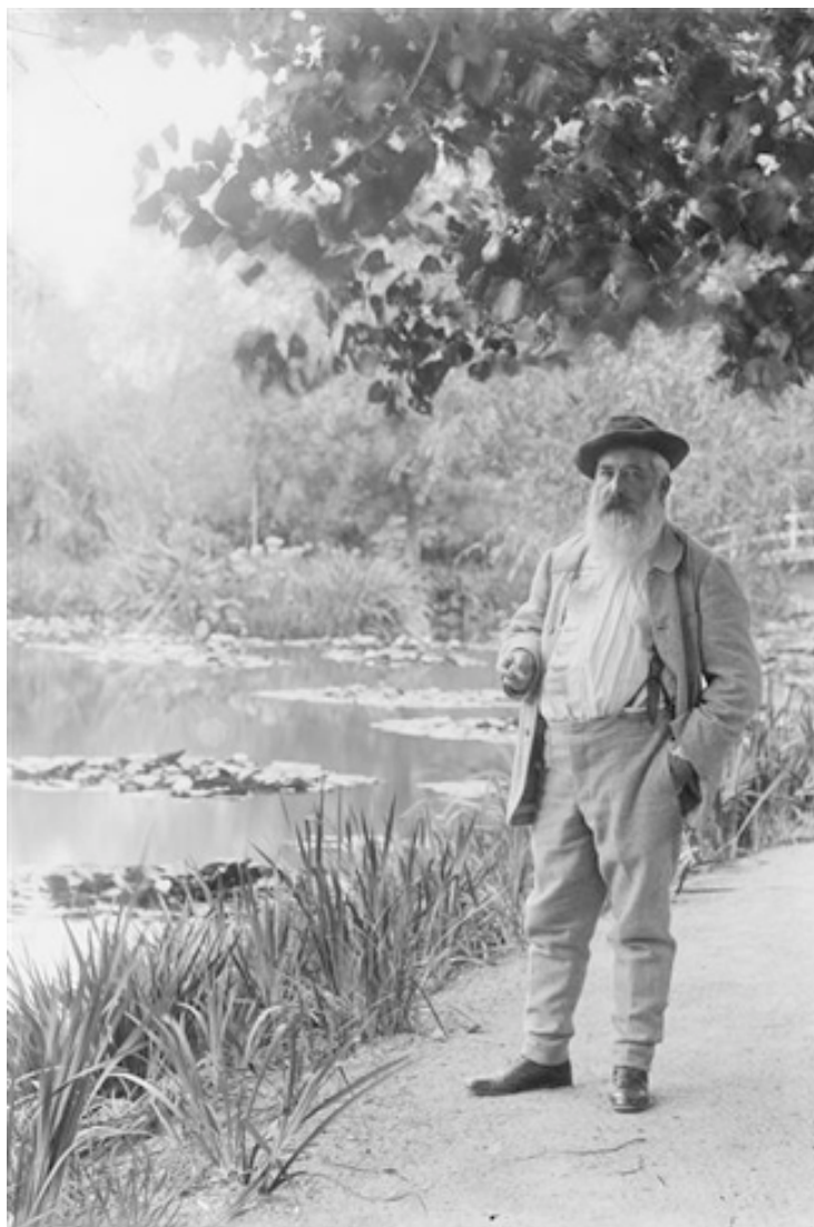
Jacques-Ernest Bulloz (1858-1942) Claude Monet près du bassin aux nymphéas, été 1905