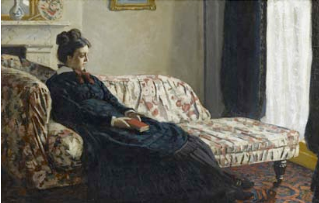
Claude Monet (1840-1926) Méditation. Madame Monet au canapé, 1870-1871 Huile sur toile, H. 48 ; L. 75 cm Paris, musée d'Orsay