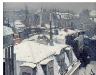
Gustave Caillebotte (1848-1894) Toits sous la neige, 1878 Huile sur toile, H. 65 ; L. 82 cm Paris, musée d'Orsay