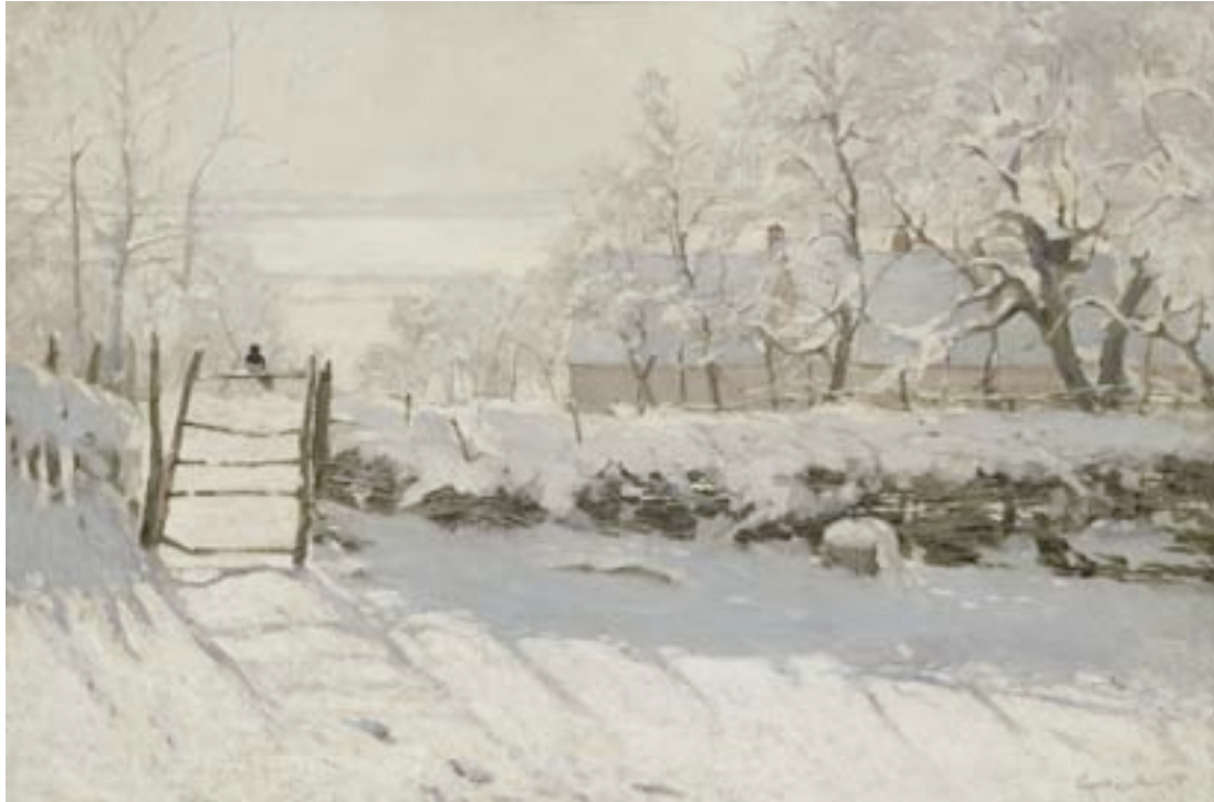
Claude Monet (1840-1926) La Pie, 1869 Huile sur toile, H. 89 ; L.130 cm Paris, musée d'Orsay