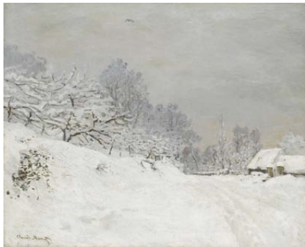
Claude Monet (1840-1926) Environs de Honfleur, neige, vers 1867 Huile sur toile, H. 81 ; L. 102 cm Paris, musée du Louvre