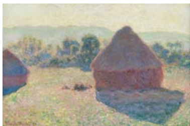
Claude Monet (1840-1926) Meules au soleil, milieu du jour, 1890 Huile sur toile, H. 65 ; L. 100 cm Canberra, National Gallery of Australia, W. 1271 Acquis en 1978