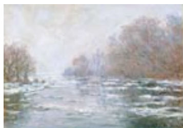
La Débâcle près de Vétheuil, hiver 1879-1880 Huile sur toile, H. 65 ; L. 93 cm Paris, musée du Louvre