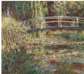
Claude Monet (1840-1926) Le Bassin aux nymphéas, harmonie rose, 1900 Huile sur toile, H. 90 ; L. 100 cm Paris, musée d'Orsay