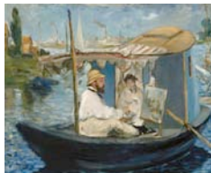
Édouard Manet (1832-1883) Monet dans son bateau-atelier, 1874 Huile sur toile, H. 82,7 ; L. 72 cm Munich, Neue Pinakothek