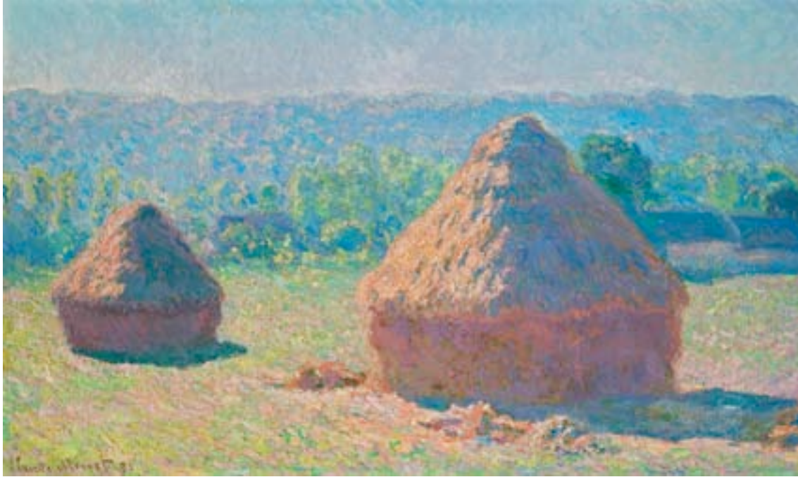
Claude Monet (1840-1926) Meules, fin de l'été, effet du matin, 1890 Huile sur toile, H. 60 ; L. 100 cm Paris, musée d'Orsay