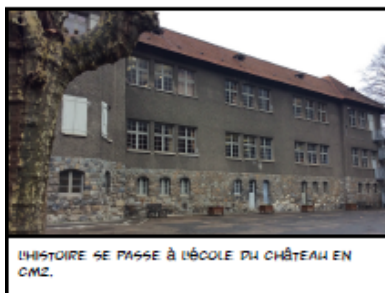
L'HISTOIRE SE PASSE À L'ÉCOLE DU CHÂTEAU EN CM2.