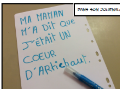
DANS SON JOURNAL: