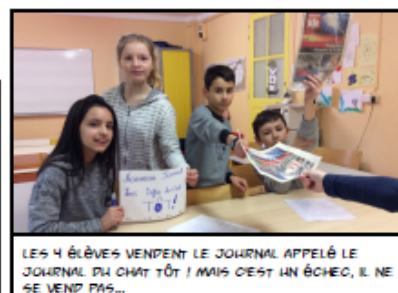
LES 4 ÉLÈVES VENDENT LE JOURNAL APPELÉ LE JOURNAL DU CHAT TÔT ! MAIS C'EST UN ÉCHEC, IL NE SE VEND PAS...