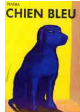
Nadja, « Chien bleu » (Pastel)

Ici, très forte redondance texte / image. Cependant l'illustration complète le titre en suggérant l'idée de la chaîne alimentaire, mais sans certitude.