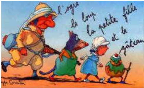
Philippe Corentin, « L'ogre, le loup, la petite fille et le gâteau » (Pastel)

Les informations sont en grande partie redondantes. Le texte et l'image disent la même chose, chacun avec son mode d'expression (l'écrit pour titre et le graphisme pour illustration). Mais il y a toujours un lien aussi minime soit-il de complémentarité entre les deux car les modes d'expression sont différents.