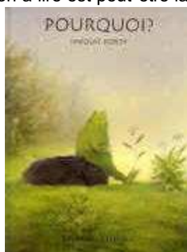
Elschner et Popov, « Pourquoi ? » (Nord – Sud)

Dans ce cas, il faut lire le livre pour comprendre le lien qui existe toujours entre le titre et l'illustration. Ici, l'incitation à lire est peut-être la plus forte.