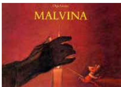
Olga Lecaye, « Malvina » (L'Ecole des Loisirs) Inquiétant