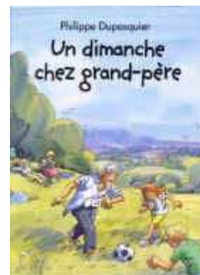
Philippe Dupasquier « Un dimanche chez grand-père » (Gallimard)