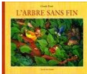
Claude Ponti "L'arbre sans fin" (Ecole des loisirs)