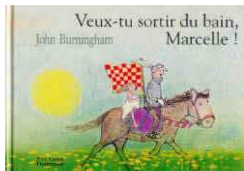
Burningham, « Veux-tu sortir du bain, Marcelle ? » (Père Castor Flammarion)

On voit une grenouille qui a l'air fatigué.