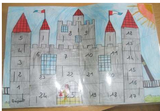
plateau de jeu

Sur le principe du jeu de l'oie, les enfants regroupés en équipe de 5 ou 6 découvriront l'histoire de notre village.