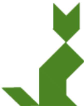
Deux autres pour réfléchir