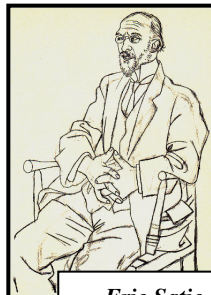
Eric Satie par Picasso

Les pièces de piano écrites par Satie de 1900 à 1920 déterminent des directions nouvelles : il se moque des conventions admises dans des pièces très courtes et satiriques, et prône une esthétique d'anti-romantisme radical.