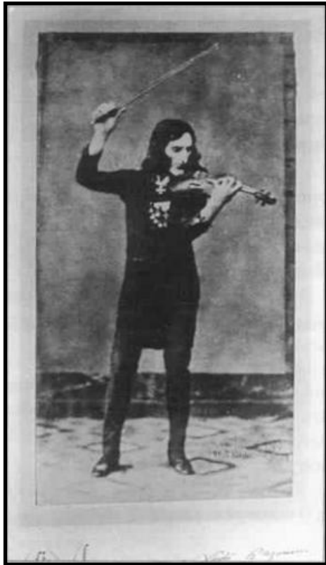
Paganini dans Harold en Italie

Musicien Isérois, Berlioz marque l'entrée de la musique française dans le vrai romantisme musical.