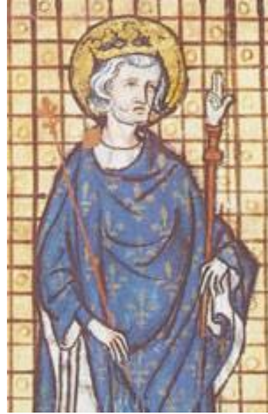
Louis IX portant les attributs royaux

Après sa mort, il sera canonisé en 1297 et il deviendra alors Saint Louis.