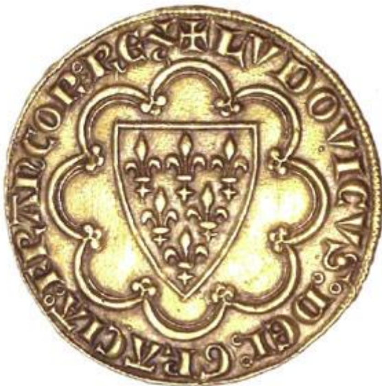
Le premier écu d'or, frappé sous Louis IX, en 1266.