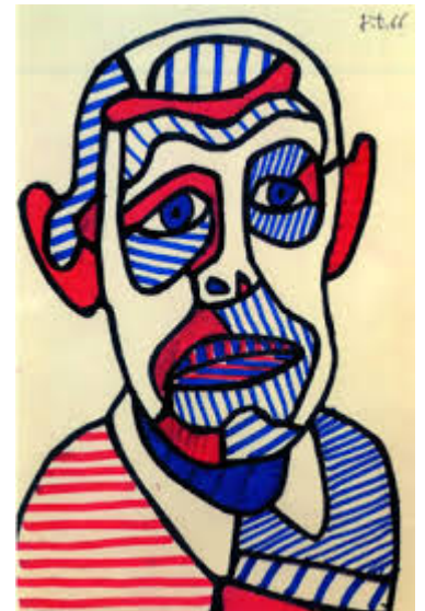
Autoportrait , 1966