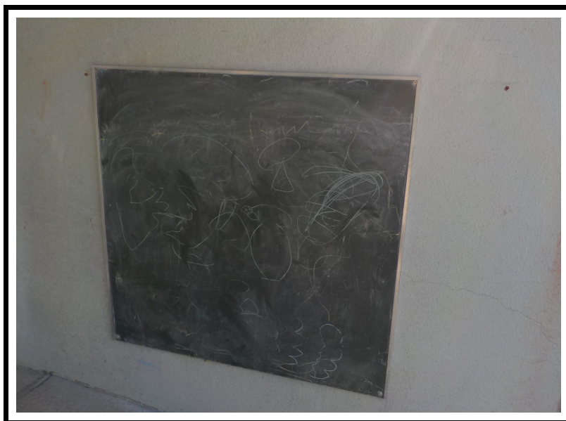
Devinette N° 2

INDICE : il y en a dans les classes mais là, ce n'est pas dans l'école ..