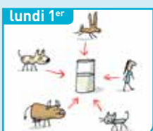
Pourquoi avons-nous besoin de lait ?

Les autres vidéos de la semaine sur www.1jour1actu.com