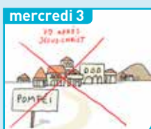
Que s'est-il passé à Pompéi ?