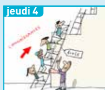
À quoi ça sert, l'école ?