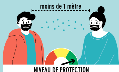
NIVEAU DE PROTECTION

Plus on est nombreux à mettre un masque, plus on est protégés.