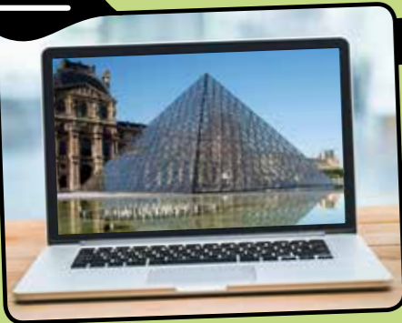
Louvre © Manuel Cohen / AFP. Ordinateur © Getty Images.

Plus de 10 millions ! C'est le nombre de visiteurs qui ont parcouru le Louvre... depuis leur ordinateur, leur tablette ou leur téléphone ces deux derniers mois. Le musée le plus visité du monde n'a donc rien perdu de son attrait, malgré sa fermeture pour cause d'épidémie.