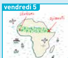
C'est quoi, la grande muraille verte d'Afrique ?