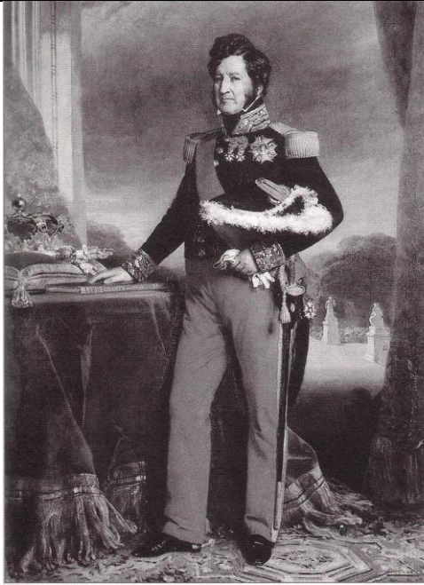
Portrait de Louis-Philippe, roi des Français de 1830 à 1848. Peinture de F. X. Winterhalter, 1839.

1. Louis-Philippe, le nouveau roi. Retour à la table des matières