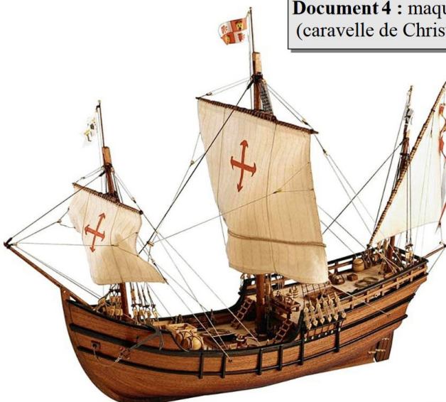
Document 4 : maquette de la Pinta (caravelle de Christophe Colomb)

http://bla-bla.cycle3.pagesperso-orange.fr/index.htm