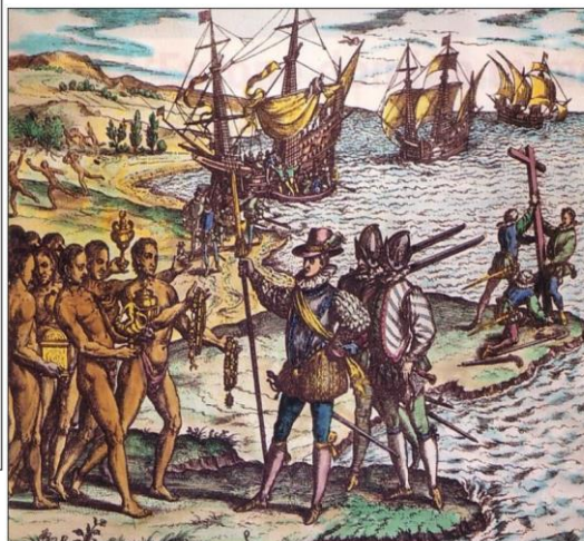
Document 6 : Arrivée de Christophe Colomb en Amérique - gravure - XVI e (16 e ) siècle.

Le portugais Magellan accomplit entre 1519 et 1521 le premier tour du monde.