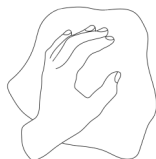
1 chiffon pour l'ardoise