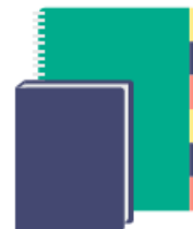
1 agenda ou 1 cahier de textes