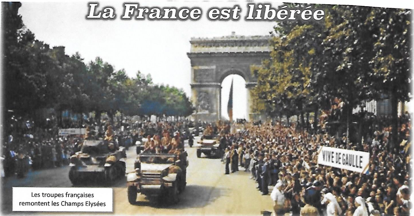
Les troupes françaises remontent les Champs Élysées

La libération de Paris a eu lieu en août 1944 , marquant ainsi la fin de la bataille de Normandie. Cet épisode met fin à quatre années d'occupation de la capitale française.