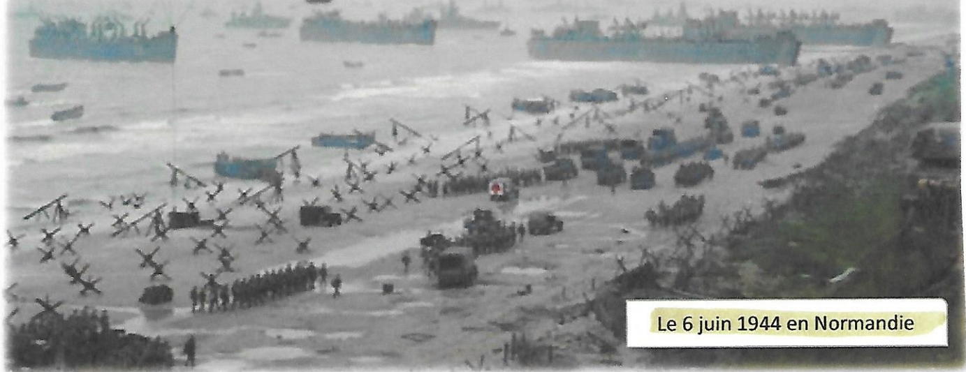
Le 6 juin 1944 en Normandie

Le 6 juin 1944 les armées alliées, sous le commandement du général Eisenhower, réussissent à débarquer sur les côtes de Normandie entre Cherbourg et le Havre, malgré les formidables remparts de béton appelés par les Allemands le « mur de l'Atlantique ».