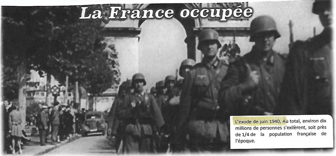
L'exode de juin 1940, Au total, environ dix millions de personnes s'exilèrent, soit près de 1/4 de la population française de l'époque.

• L'armistice, 25 juin 1940. De Bordeaux où il s'était retiré, le gouvernement du Maréchal Pétain demanda un armistice: Les conditions en furent très dures : la moitié de la France deux millions de prisonniers, lourde indemnité de guerre à payer au vainqueur.