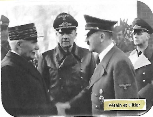
Pétain et Hitler

Les juifs ne sont pas seulement touchés par les difficultés de la guerre. Ils sont aussi victimes de la politique antisémite mise en place par le gouvernement de Pétain : statut des juifs, port de l'étoile jaune , arrestations, déportations vers les camps d'extermination .