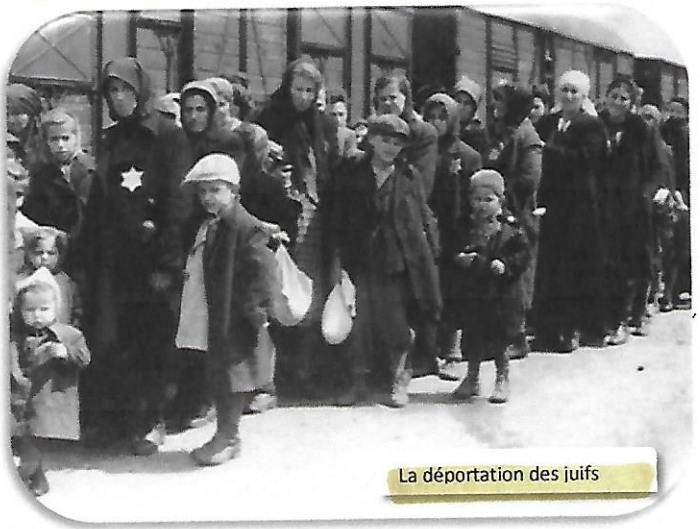
La déportation des juifs

Avec son principal ministre, Laval , il offrit la collaboration de la France à l'Allemagne. Les Allemands furent des maîtres impitoyables. Sans souci des besoins des Français, ils emportèrent récoltes, machines, matières premières.