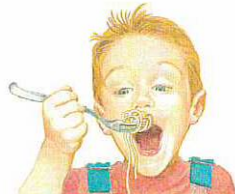
Arnaud mange des spaghettis.