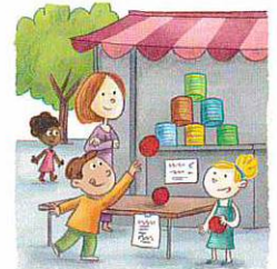
Kevin s'amuse au stand du « chamboule-tout ».

① Par quelle lettre commencent tous les mots de ces deux pages ?