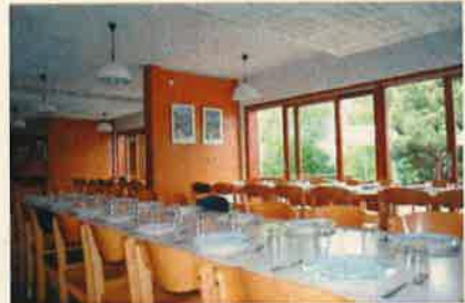
La salle à manger