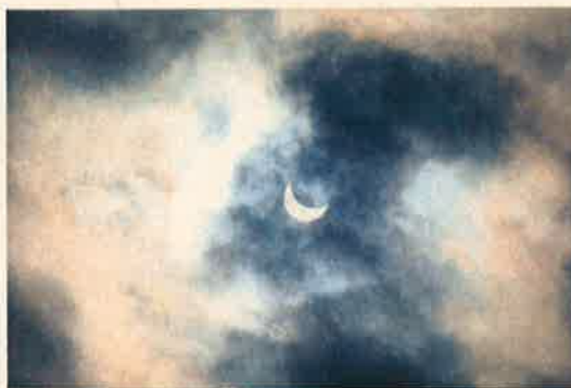
L'éclipse avant que les nuages ne se referment