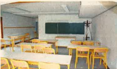
La salle de classe