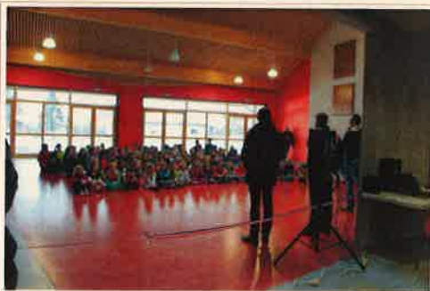
De dos, M. l'inspecteur, M. le Maire et M. le Directeur, et au premier plan le ruban de l'inauguration

L'inauguration de la nouvelle école s'est déroulée le 23 février à 15h30 dans le préau couvert et en présence de M.le Maire, M.l'inspecteur, des enseignants, des élèves, des parents d'élèves et de certains personnels de mairie.