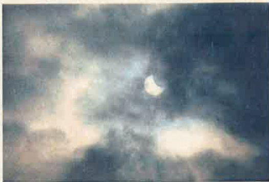
L'éclipse au début