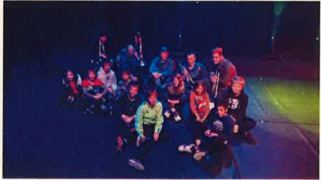
Quelques élèves de CM2 avec des comédiens du BCA