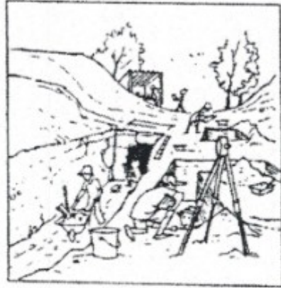
Les archéologues effectuent des fouilles.