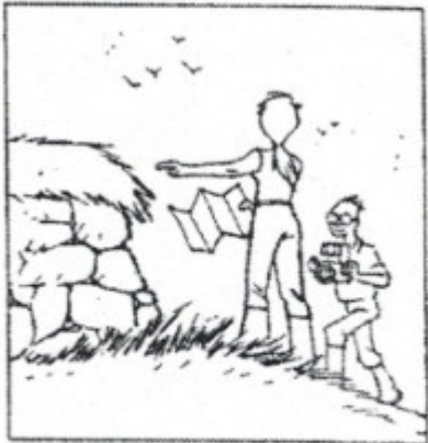
Les archéologues repèrent un site riche en vestiges.