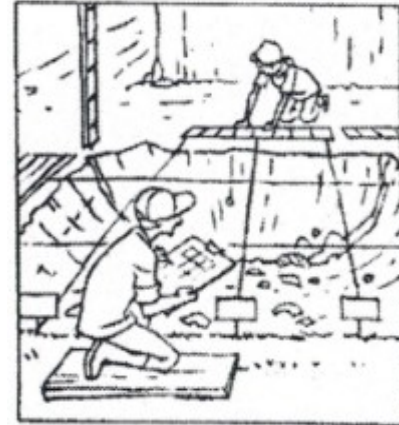
Ils quadrillent le terrain pour situer les découvertes.