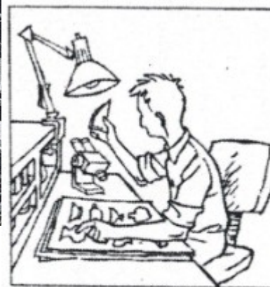
Ils interprètent ce qu'ils ont découvert.