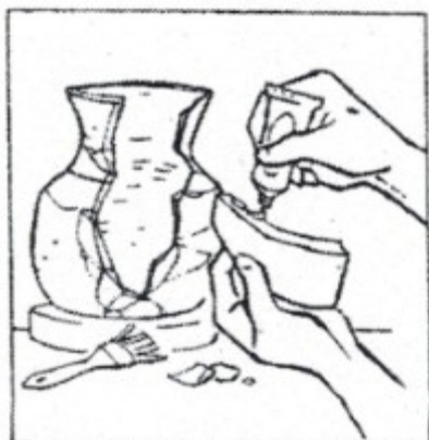
Ils reconstituent les vestiges.