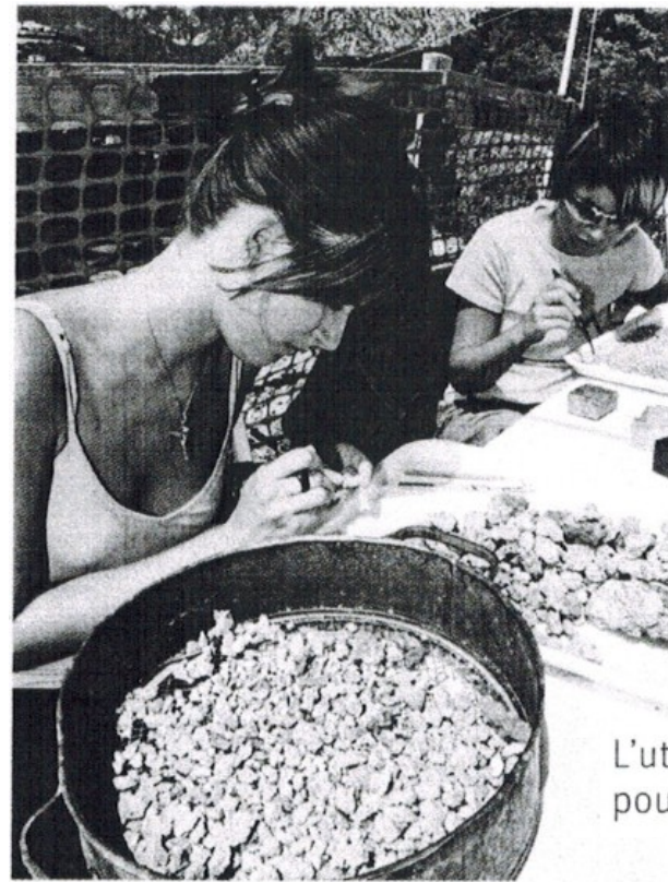
L'utilisation de tamis pour récupérer des vestiges.