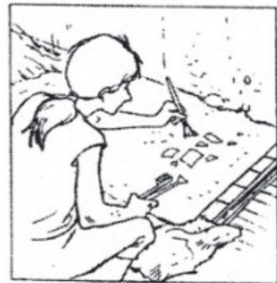
Les archéologues dégagent délicatement les vestiges.