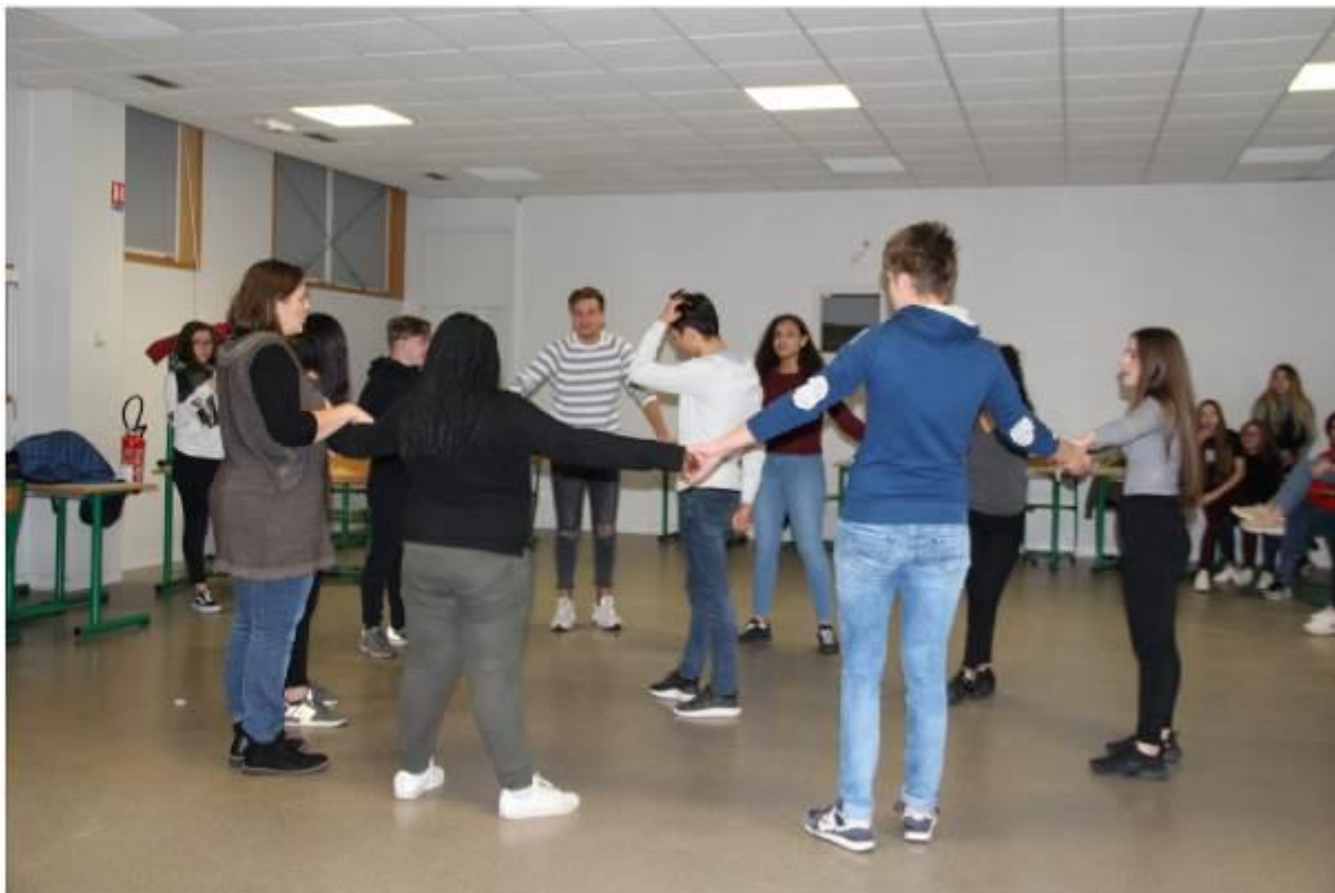
Figure 4 Préparation de chorégraphies permettant d'éprouver physiquement et d'illustrer les notions de liens sociaux, de confiance et de solidarité.