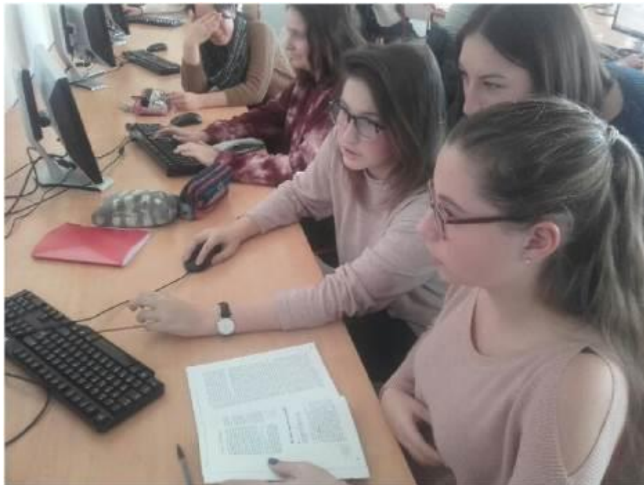
Figure 1 Séance de recherche sur les différentes conceptions de la solidarité