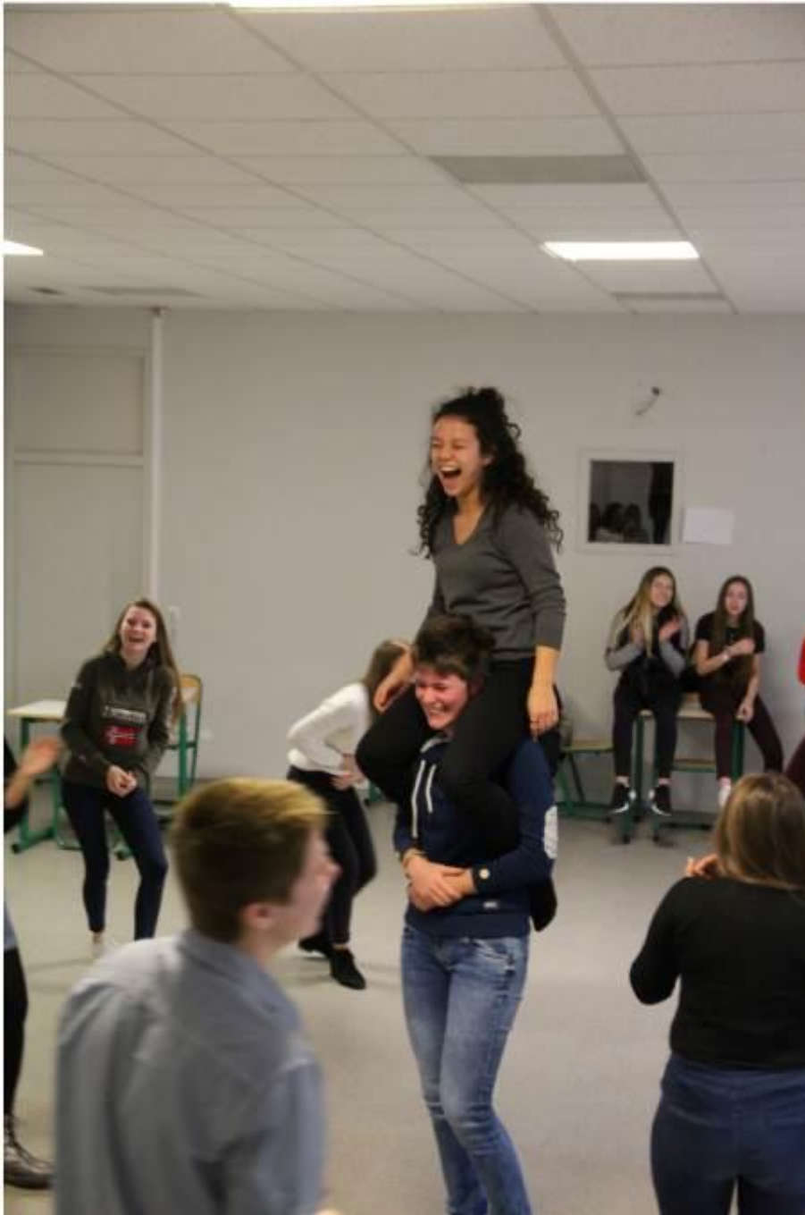
Figure 6 Joie partagée !