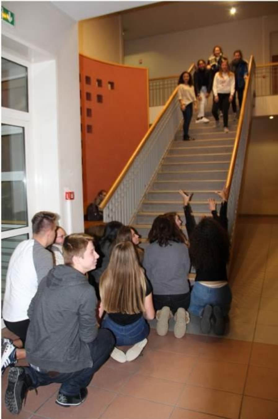
Figure 7 Comment illustrer la charité religieuse ?