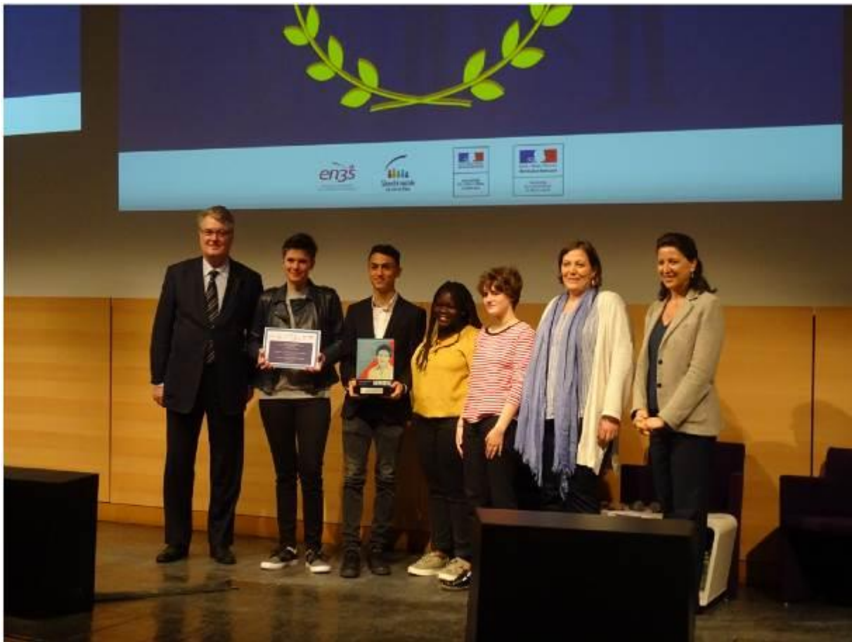
Figure 8: Cérémonie Nationale de remise des prix en présence de Mme la Ministre Agnès Buzyn et de Jean-Paul Delevoye, Président du Jury National. Ministère des Solidarités et de la Santé, le 27 mars 2018.