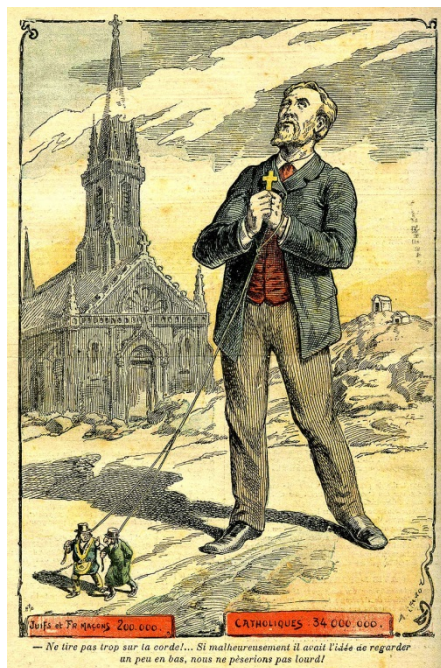
( Achille Lemot pour Le Pèlerin , numéro du 31 août 1902).

Visionnage de la vidéo « Rumeur et Théorie du complot »