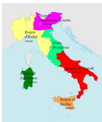
Prima il Risorgimento