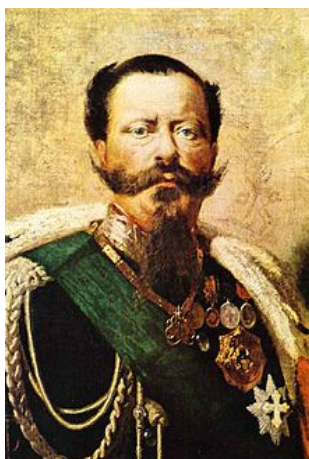
Vittorio Emmanuele II

Vittorio Emmanuele II è nato nel 1820 a Torino e è morto nel 1878 a Roma. Era il primo Re d'Italia, regnava sul Regno di Sardegna. Suo figlio si chiama Umberto I.