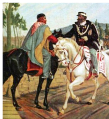
Vittorio Emmanuele II e Giuseppe Garibaldi

Vittorio Emmanuele II e Giuseppe Garibaldi hanno lotato insieme per l'unificato dell'Italia.