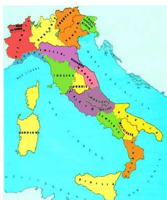
Dopo il Risorgimento

Nel 1815 il paese era diviso (doc 1), è totalmente unificato nel 1918 (doc 2).