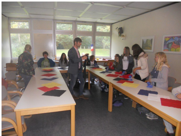
Accueil de nos élèves par le principal-adjoint du collège de la GAZ et discours de bienvenue à Kassel.