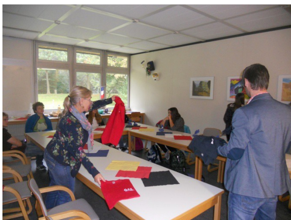
La remise des tee-shirts du collège de la GAZ dans la salle de réunion.