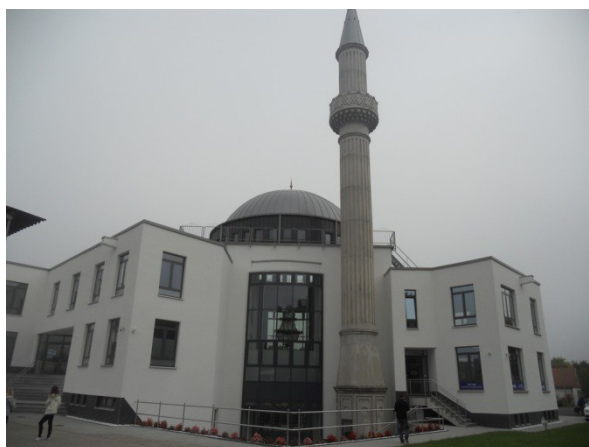
Visite de la mosquée de Kassel dans le quartier où se trouve le collège, ouverte au public, musulman ou non.