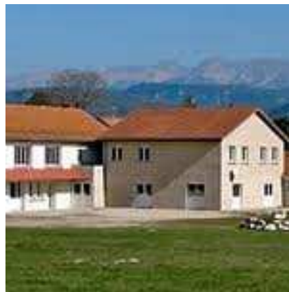
Le centre d'hébergement la Gélinotte