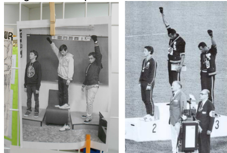
Tommie Smith et John Carlos lèvent leur poing ganté aux JO de Mexico en 1968.