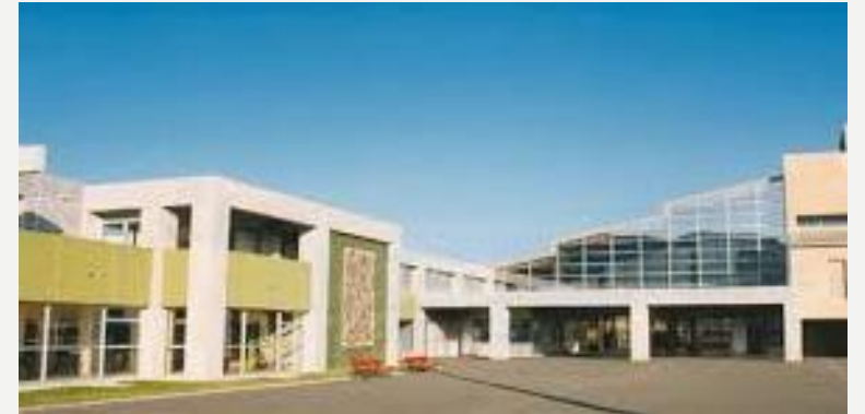
Collège Charles de Gaulle