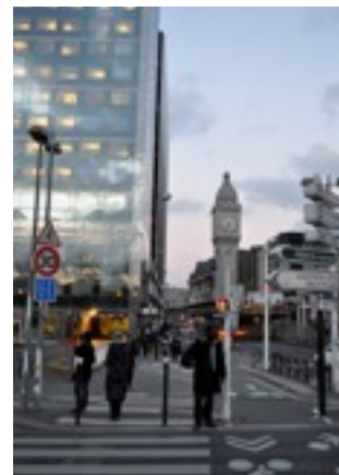
La gare de Lyon