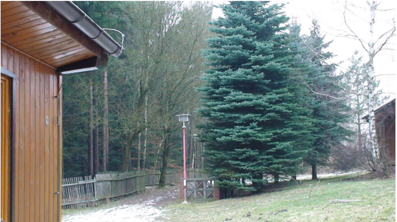
A l'extérieur du camp: la forêt