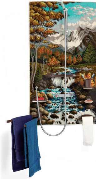
Daniel Spoerri, Détrompe l'oeil, 1973

OÙ TROUVE T-ON HABITUELLEMENT LES OBJETS FIXÉS SUR CE TABLEAU ?