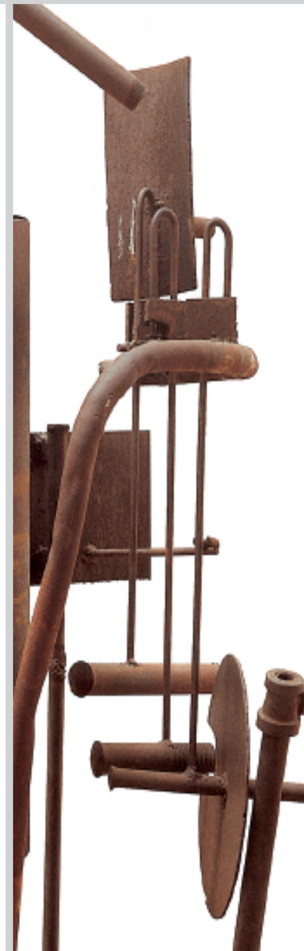
Richard STANKIEWICZ, Sans titre , 1960