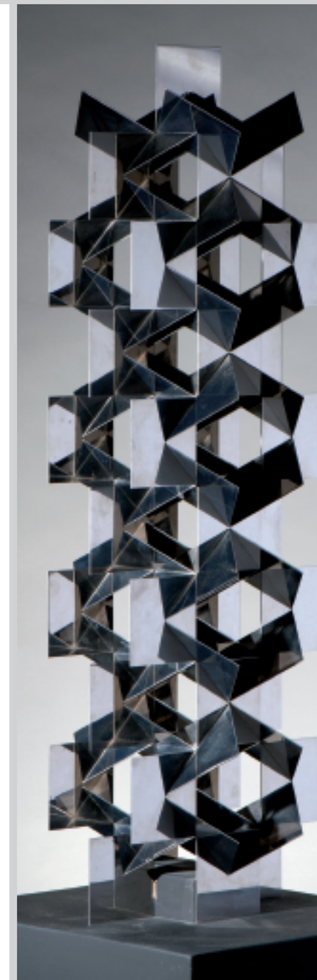
Francisco SOBRINO, Sans titre , 1970

Entrée libre. Renseignements auprès de la MJC Prémol