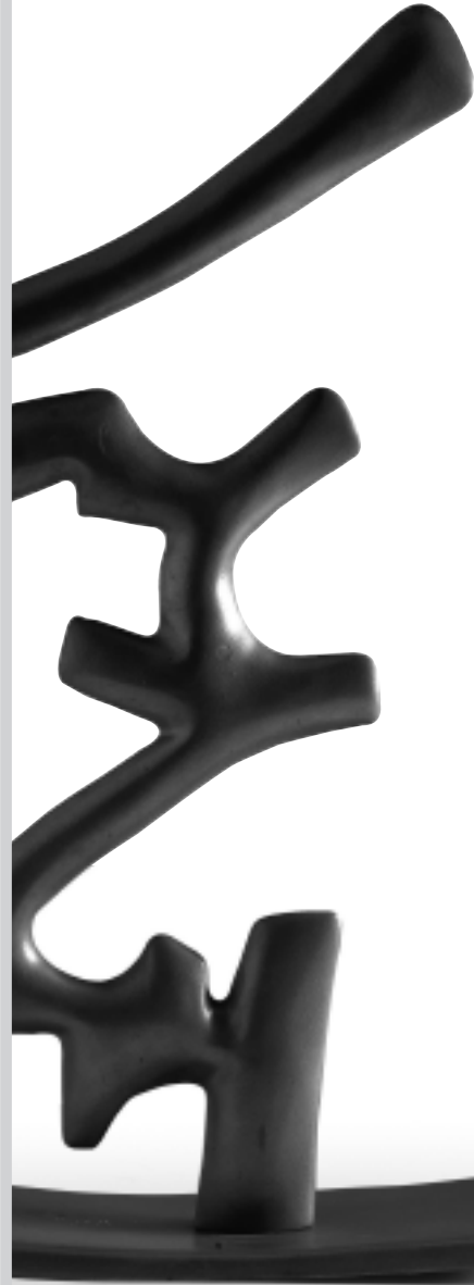
Etienne HAJDU Courbes et contre-courbes , 1971

Renseignements auprès du Centre social Prémol : 04 76 09 00 28